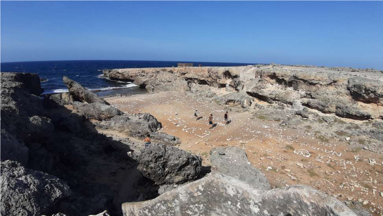
A "Boca pistol"