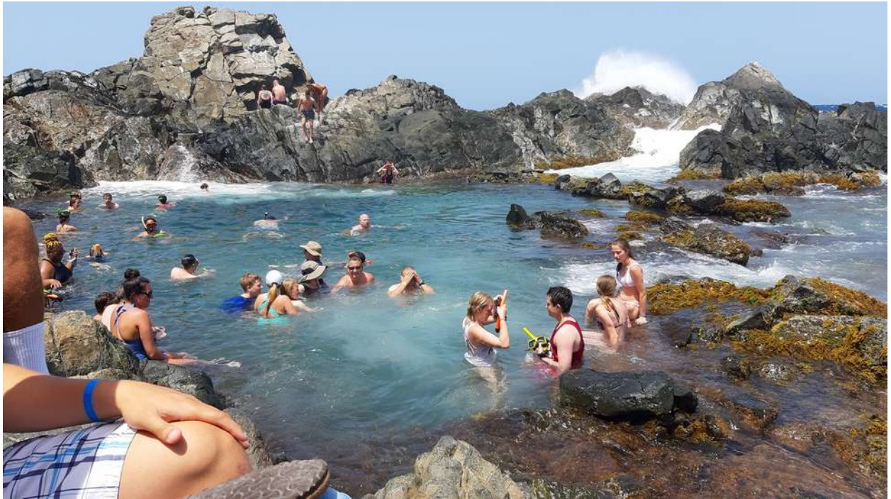
A Quadiriki barlangok